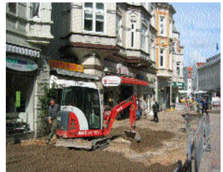
Die Umbauarbeiten haben begonnen, Mai 2003