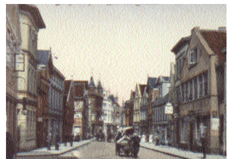
Sachsenor um 1920