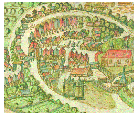
Die Frese-Karte von 1593 (Ausschnitt) zeigt u. a. den Verlauf des Blickgrabens mit dem Sachsenor über den Graben zwischen den heutigen Hs.Nr. 40 zu 53

Die zahlreich vorhandenen alten Photos und Postkarten der Jahrhundertwende zeigen - im Vergleich mit der heutigen Situation - deutlichen den Wandel der Straße. In Stadtteilbüchern, Diavorträgen