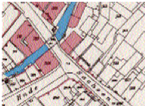
Der Blickgraben in einer Karte von 1880

Anlässlich der Planungen zur Neugestaltung der Bergedorfer Fußgängerzone Sachsenor gab es im BBV Überlegungen, wie z. B. die Geschichte der Straße als Teil der Stadtteilgeschichte mit sichtbar gemacht werden könnte. Dabei kamen wir wieder auf den schon vor Jahren geäußerten Vorschlag: „Die Lage des alten Stadtgrabens, des Blickgrabens, sollte andersfarbig aufgepflastert werden“. So beschloß die Jahreshauptversammlung 2002, dass der BBV-Vorstand sich für eine Pflasterung mit blauen Klinkern einsetzt.