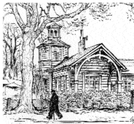
W.Götze, Der alte Bahnhof , 1969

Über das Grundstück selbst führt parallel zur Brookwetterung ein neuer Wanderweg, der den Neuen Weg mit der Vierlandenstraße verbindet. Ihm folgend gelangt man über die Friedrichsbrücke (Schleusengraben) schnell zum dritten Bergedorfer Bahnhof - dem DB- und S-Bahnhof von 1937!