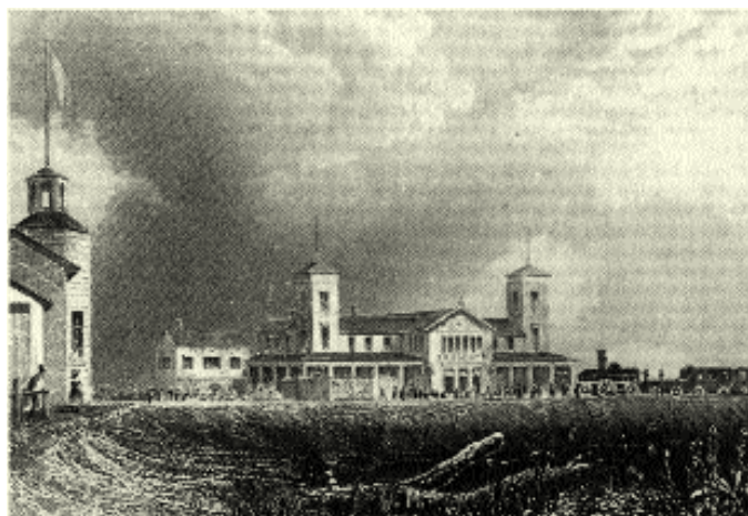
A. H. Payne, Kassenhaus und Frascati, 1842

Das Bergedorfer Gehölz, vor allem aber die gepflegten Gaststätten, die am Endpunkt der Bahn erbaut wurden, sollten Gäste locken. Es waren am Neuen Weg die großen neuen Wirtsbetriebe Frascati, Collosseum, Portici und die Eisenbahnhalle (später Hitscher). Diese Namen waren damit Paten für die Bezeichnung „Italienisches Viertel“. Der Neue Weg war damals der Hauptweg vom Städtchen Bergedorf in die Vierlande!