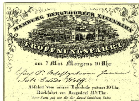
Die Einladung zur 1. Fahrt zeigt den Bahnhof in Hamburg-Hammerbrook

So mußte die Bahnlinie innerhalb Bergedorfs verschwenkt werden und der Ort erhielt 1846 einen neuen, zweiten Bahnhofsbau - jetzt an der Grenze zu Sande-Lohbrügge. Damit war die Errichtung der Gaststätten-Bauten am Neuen Weg eine erste Fehlspekulation der beginnenden „neuen Zeit“.