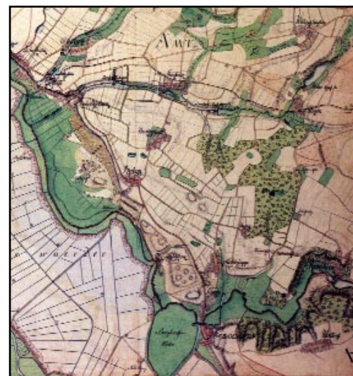
Ausschnitt Bergedorf-Boberg aus der Varendorf-Karte