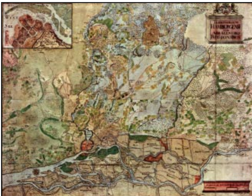
Die Klefeker-Karte von 1745