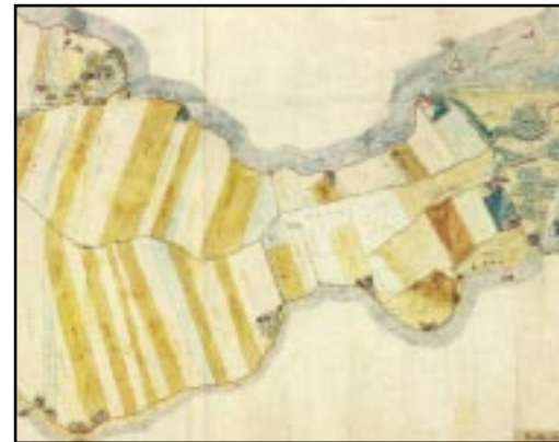
Ausschnitt aus der Billwerder-Behrens-Karte von 1623

Das von Johann Klefeker sen. 1745 gefertigte Kartenblatt „ Hamburg und Umgebung “ zeigt das hamburgische Staatsgebiet und geht bis weit in die nördlichen Nachbarschaftsgebiete hinein. So sind die