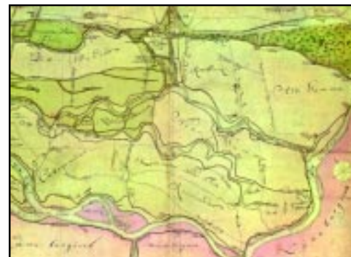
Der rechte Teil der Karte: Elbarme und Elbinseln bei Hamburg, 1702