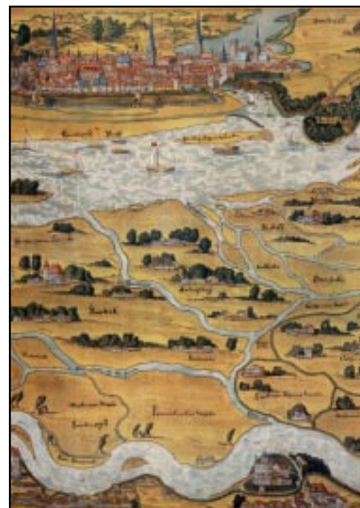
Ausschnitt aus der Elbkarte von 1568

Der hier abgedruckte und illustrierte Text: „Historische Karten zeigen Stadtteilgeschichte“ bezieht sich auf einen Diavortrag, den der Autor im März 2004 vor dem Vierländer Kulturverein „De Latücht“ gehalten hat.