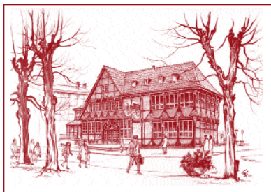
Diese vier Götze-Originale übergab der BBV dem Museum für die Sammlung.