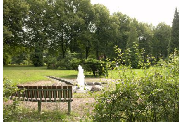
Besuchenswert nach dem Umbau: Die Grabstein-Sammlung und ein neu angelegter Wasserplatz.